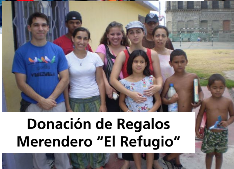
Donación de Regalos Merendero "El Refugio"