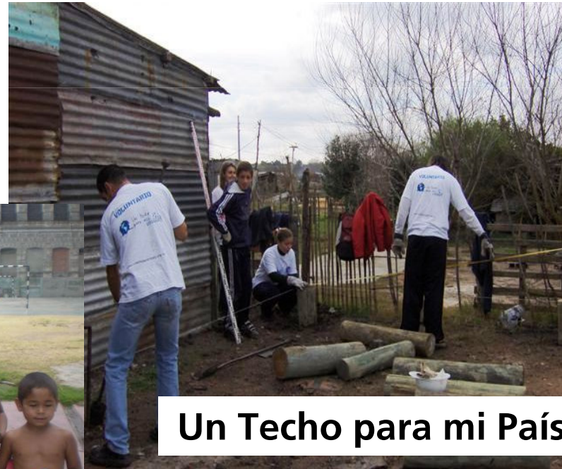
Un Techo para mi País