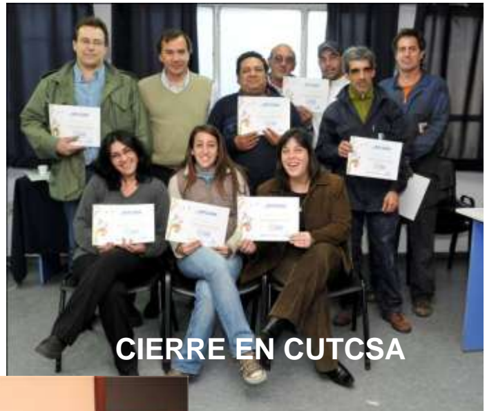
CIERRE EN CUTCSA