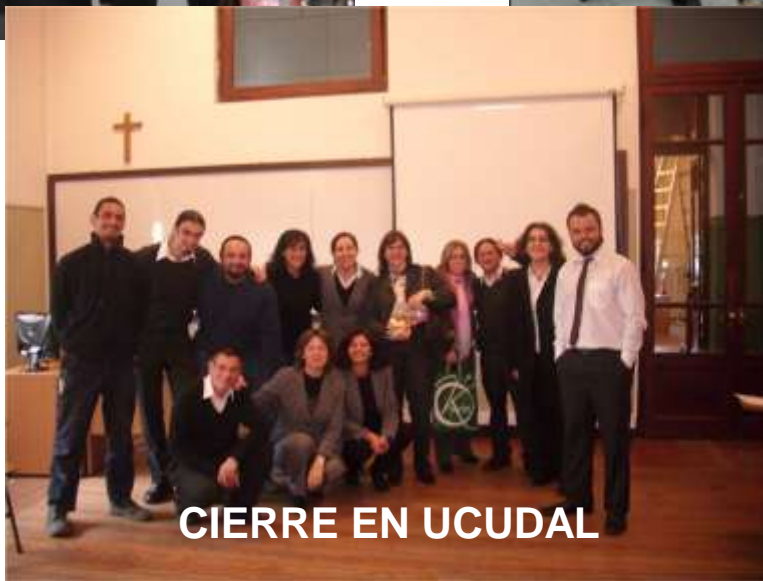
CIERRE EN UCUDAL