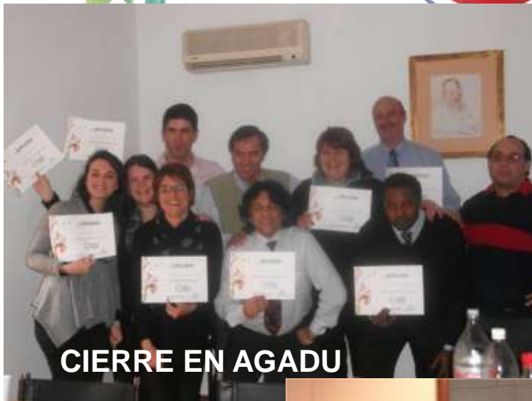
CIERRE EN AGADU