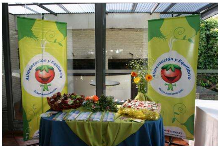
Gustino en la RII (Frutas y tips)