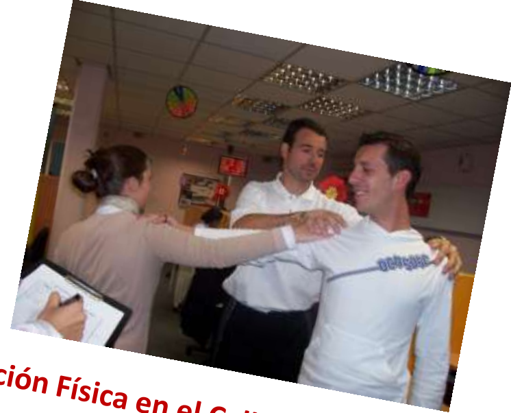
Educación Física en el Call Center