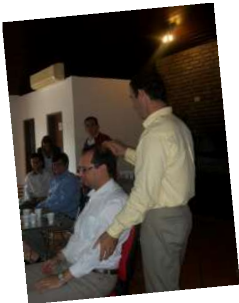
Lanzamiento programa RSE