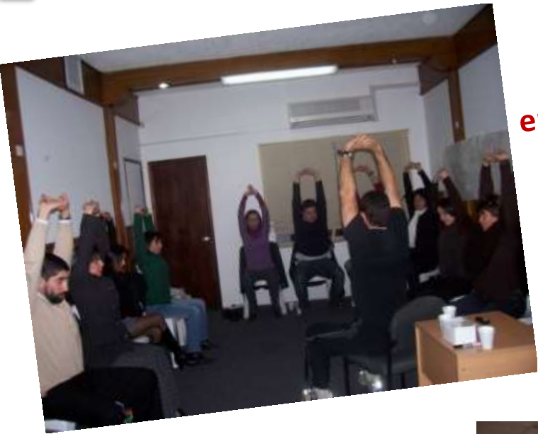
Presencia en Capacitaciones