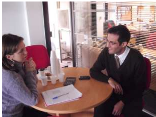
Visitas en Casa Central