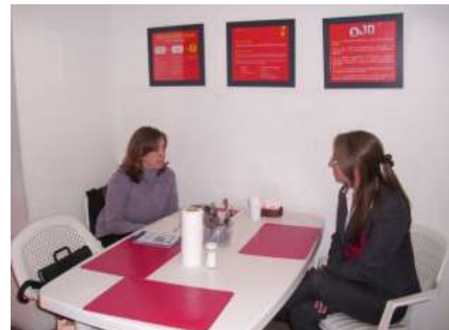
Visita Sucursal Paraguay

❑ Lic. en Nutrición visita las distintas áreas propiciando instancias de intercambio personalizada sobre alimentación saludable