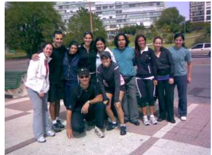
Entrenamiento por la Rambla