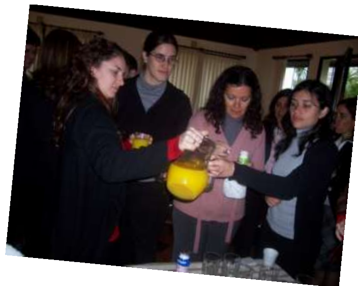
Desayuno saludable en reunión de mandos medios